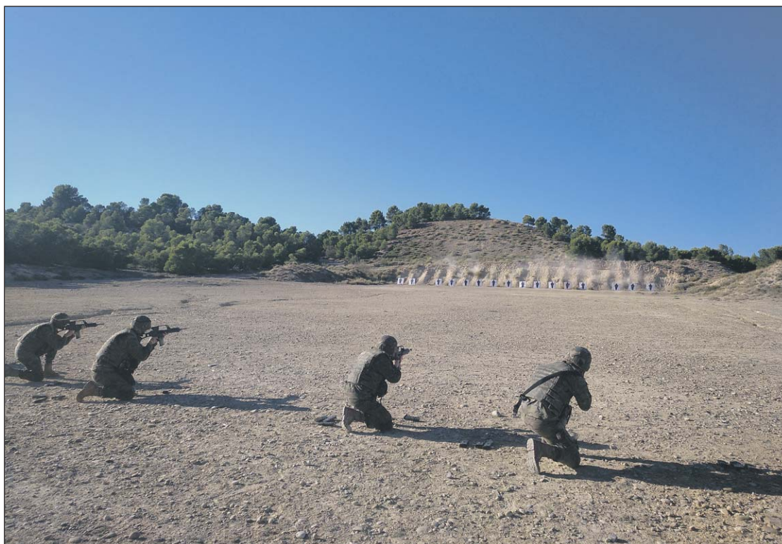
Las tres primeras semanas de curso se han dedicado a la instrucción y el adiestramiento.

El nerviosismo que mostramos los primeros días debido al cambio de compañeros y de habitaciones es rápidamente aplacado por la ilusión y las ganas de trabajar. Sin duda, el sentimiento de compañerismo presente en todo momento en la vida en La General permite