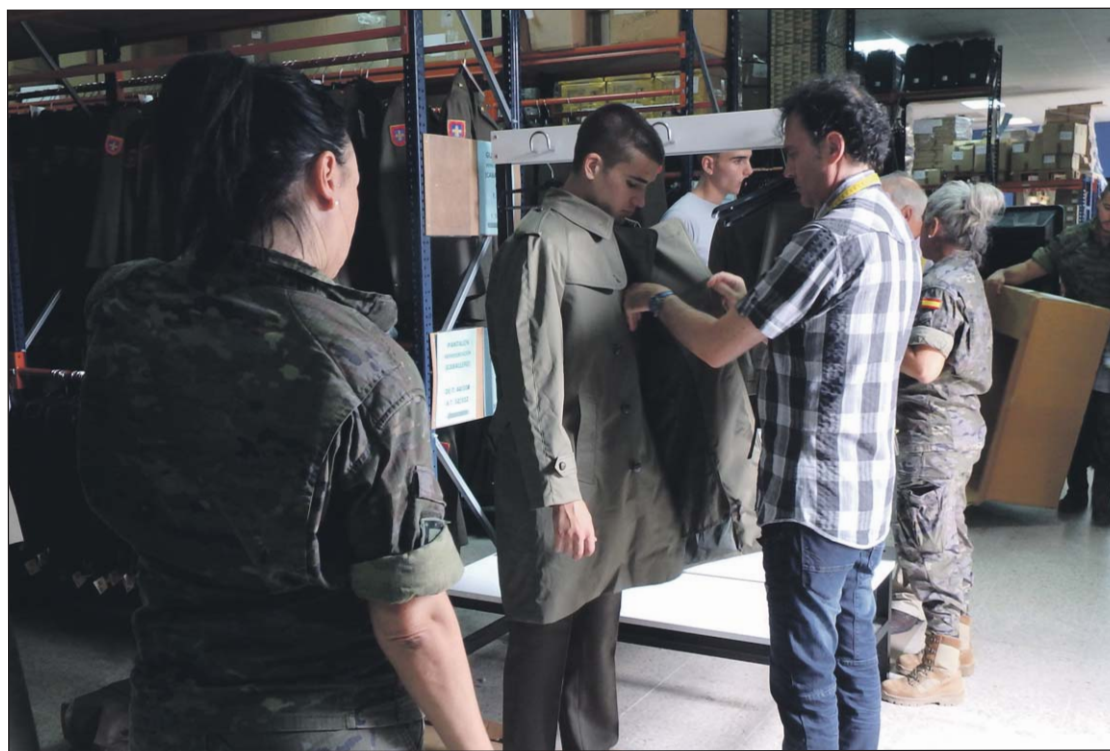
Los cadetes pasan uno por uno por el Vestuario para tomarles medida y recoger el material.

ciones, cuando sale una, entra la siguiente y el proceso se repite. Cuando ya están vestidas todas las secciones, se hacen las posibles incidencias.