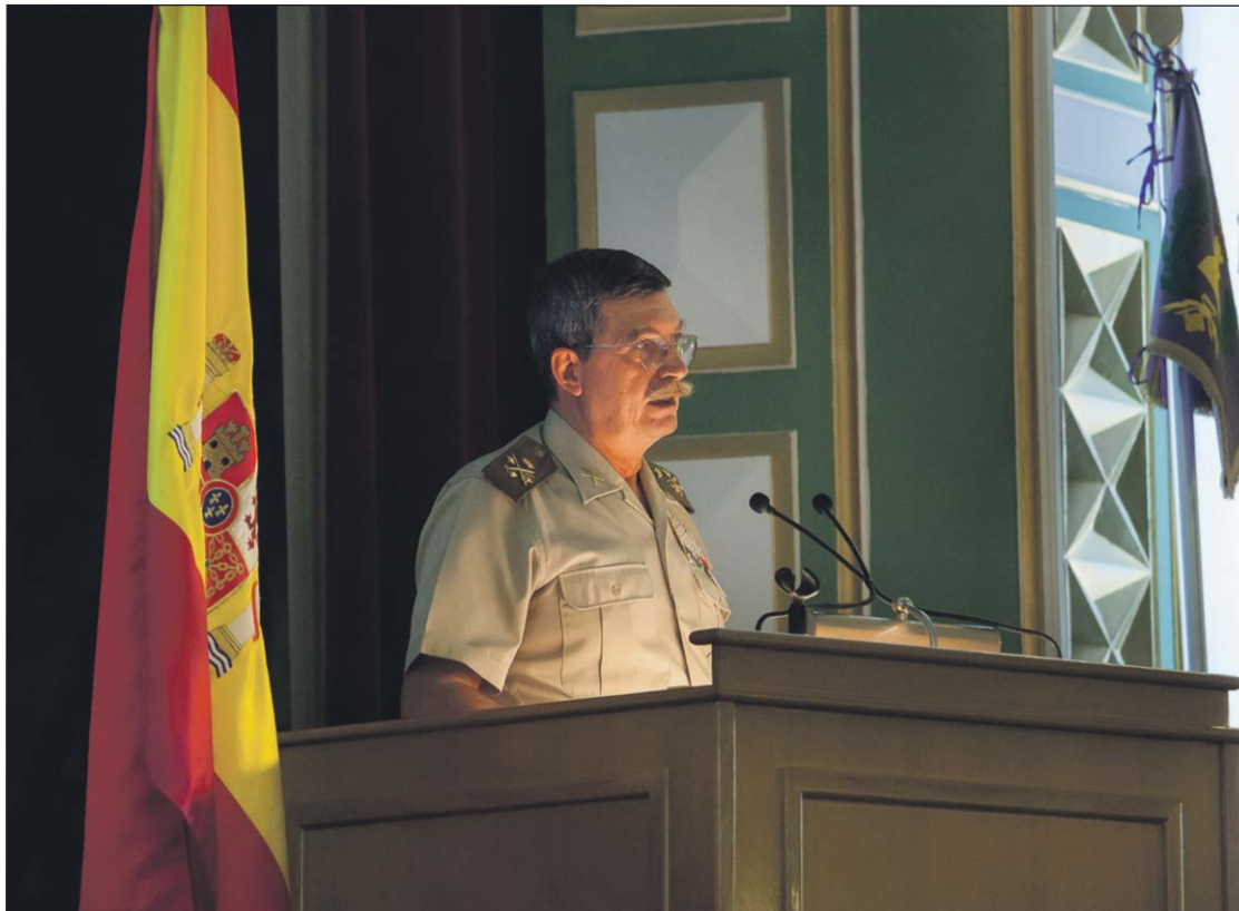
Un momento de la conferencia del Teniente General José Carrasco Gabaldón.

ca actual, se nos presenta un complejo escenario global de rápido y continuo cambio en un contexto multipolar, donde resulta difícil el proceso de toma de decisiones, las alianzas se debilitan y en el que aparece una clara tendencia a la proliferación de regionalismos, conflictos y acciones violentas.