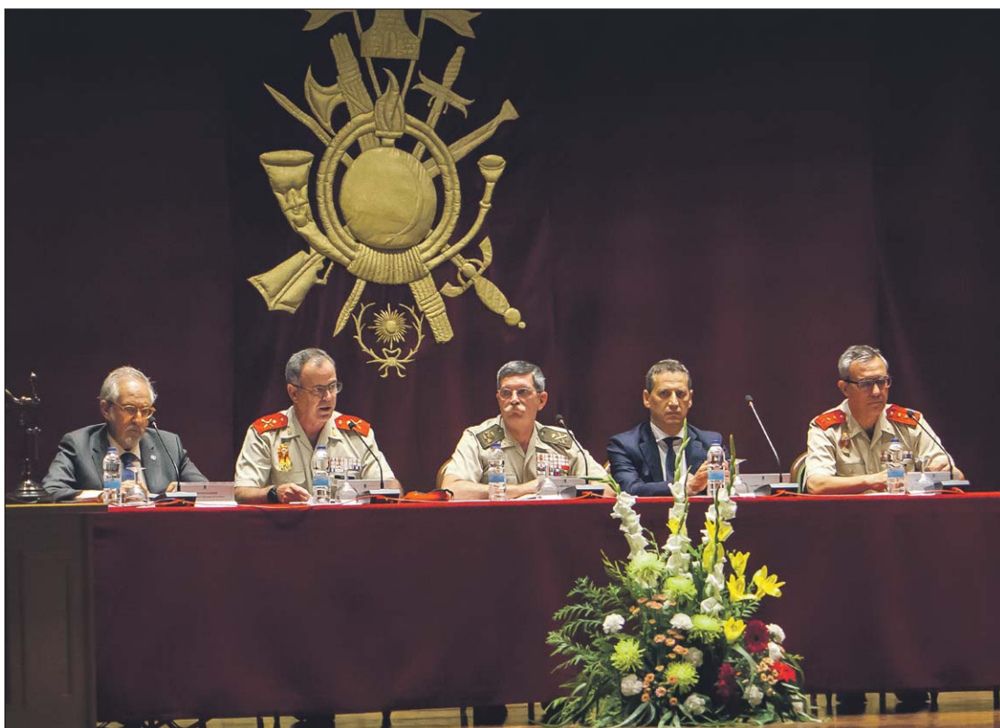
La mesa presidencial de la inauguración del curso 2018/19 en la Academia General Militar.