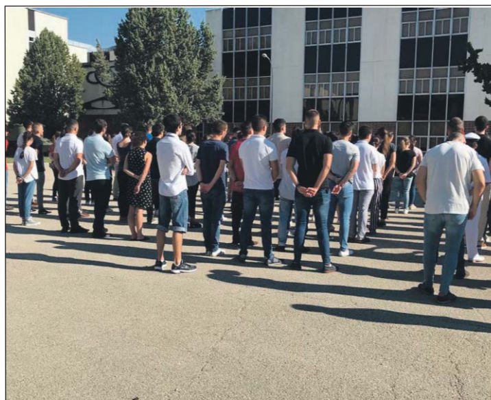
Los nuevos cadetes, recibiendo las primeras charlas en la AGM.

Entre otras cosas, se interesó por el horario de salidas, las características de las instalaciones, los planes de estudios y la organización de la propia carrera con la vida militar y, también, cuestiones básicas sobre si podía comprar algo que necesi-