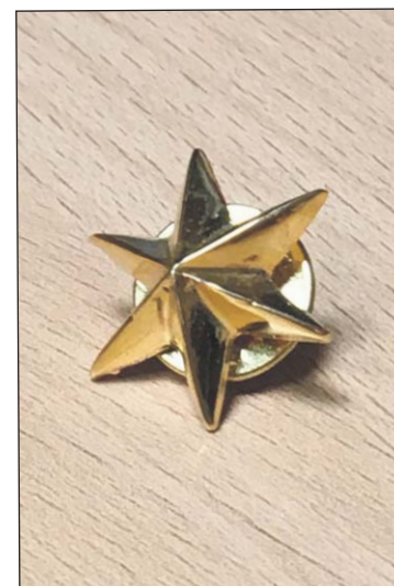
La estrella de alférez.

Es por ello que desde mi posición actual me dirijo hacia todos los que estáis en proceso de obtener el empleo de Alférez. Luchad, luchad con todas las armas que están en