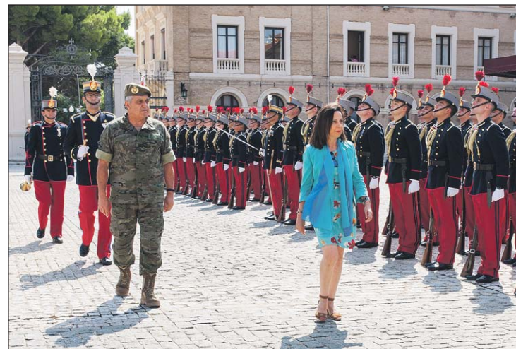
La Sra. Ministra de Defensa, en el Patio de Armas.