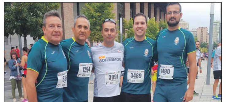
Algunos de los participantes de la Academia.