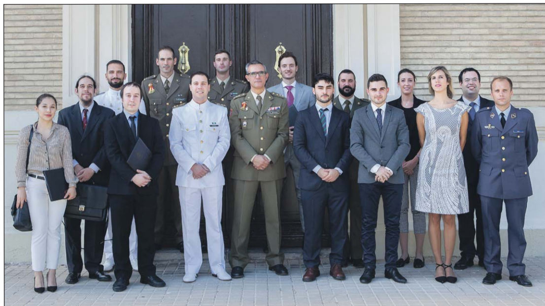
Los participantes en el V Curso Nacional de Defensa para Jóvenes.

Este es un curso de Altos Estudios de la Defensa que per-