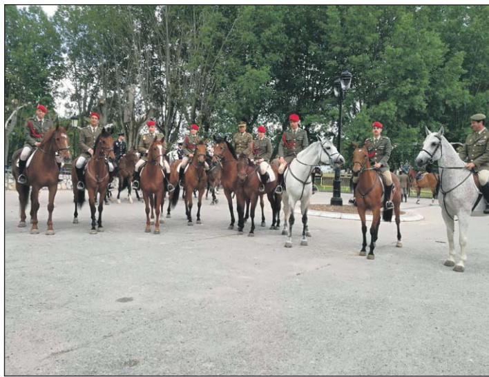
Los jinetes que representaron a la Academia General Militar.

El segundo equipo de la Academia, el AGM rojo, comenzó con el recorrido del CC. Pedro