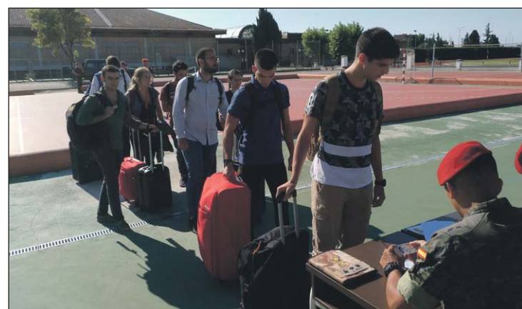
Los alumnos, nada más llegar a la Academia

Posteriormente, asistió a una sesión en la que conoció los detalles del plan de estudios de los cadetes, y en el Salón de Actos se reunió con los alumnos a quienes felicitó por su vocación de servicio a España.