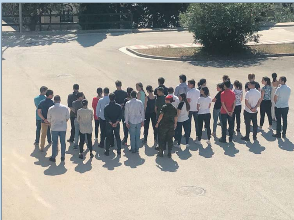
El Módulo de Acogida se inició nada más llegar los alumnos a la Academia.

Una vez terminado el Módulo de Acogida, Orientación y Adaptación a la vida militar (MAOA), los flamantes nuevos