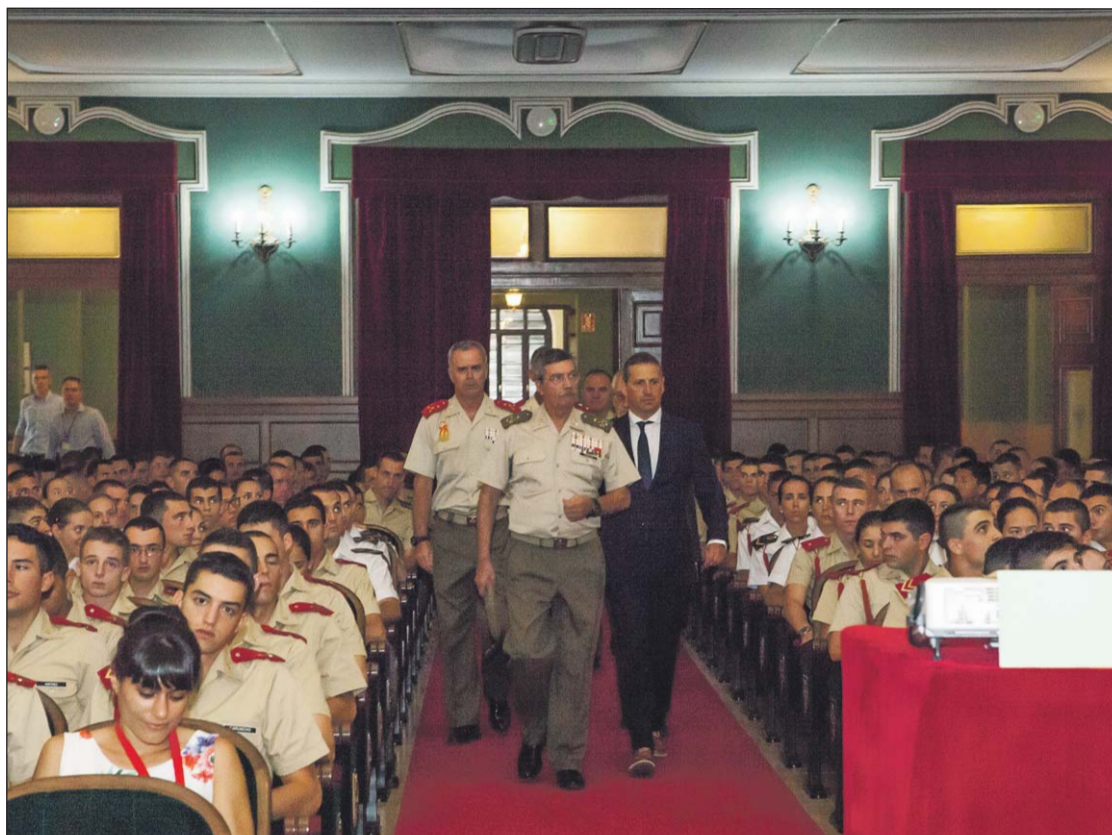
Los cadetes conocieron las características del entorno operativo futuro.

Como norma general, la experimentación de la BRG II, se desarrollará en el CMT de "Álvarez de Sotomayor" y CMT de las "Navetas". Las actividades de experimentación se dirigirán fundamentalmente, con un enfoque integral, cooperati-