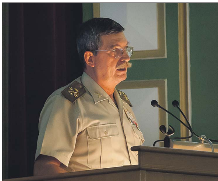
El Jefe del MADOC, durante su conferencia en la AGM.

En un amplio artículo explica las características que tendrá el entorno operativo en el futuro inmediato y de qué forma los futuros oficiales se van a tener que adaptar a él.