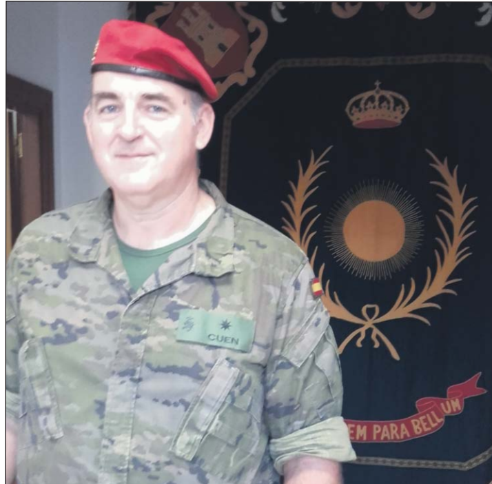
El Comandante Cuen llegó destinado a la Academia en 2015.

En la AGM he realizado las funciones de profesor del área de contabilidad en el Departamento Economía, Administración y Abastecimiento, además de ejercer la función de Secretario de dicho Departamento durante todo el periodo en el que he estado destinado en el mismo, habiendo ejercido además el cargo de CISPOC. He impartido clases de contabilidad a los cursos 1º y 2º CINET, así como a los alumnos de los distintos cursos de perfeccionamiento del